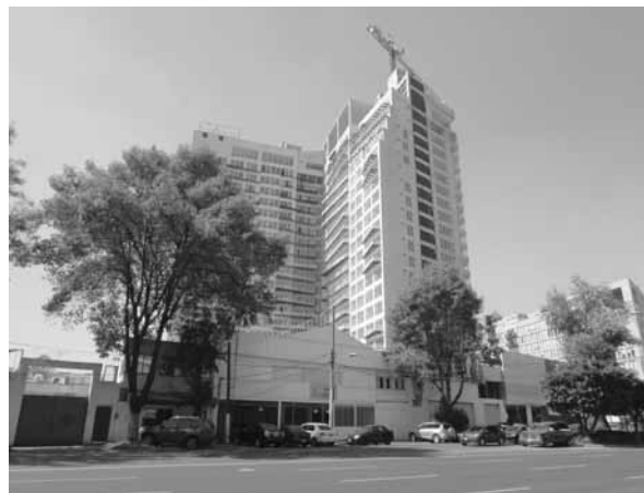
FIGURA 6. XOCO. CITY TOWERS.