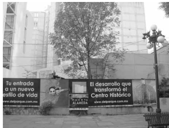
FIGURA 5. ALAMEDA SUR. ANUNCIO DE NUEVOS DEPARTAMENTOS.