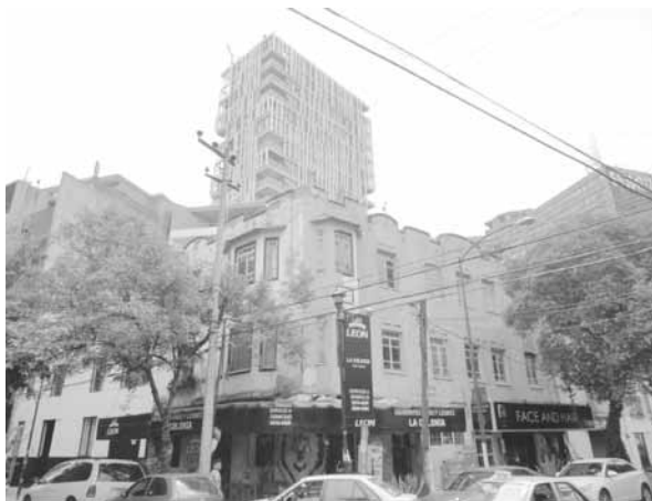
FIGURA 7. CONDESA. AL FONDO, DENSIFICACIÓN EN TORNO A VIALIDADES PRIMARIAS.