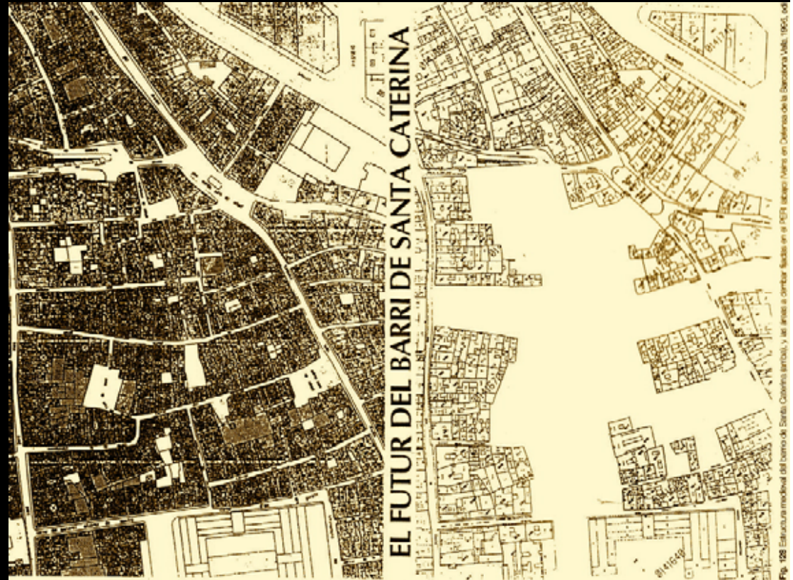
Fig. 128 Estructura modular del barrio de Santa Caterina (arriba), y su área de demolición (abajo) en el Plan Especial del Barri de Santa Caterina (1965).